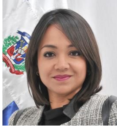
Diputada Faride Virginia Raful Soriano