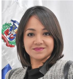
Diputada Faride Virginia Raful Soriano

CÁMARA DE DIPUTADOS DE LA REPÚBLICA DOMINICANA Asistencia a Comisiones del 27/02/2017 al 26/07/2017